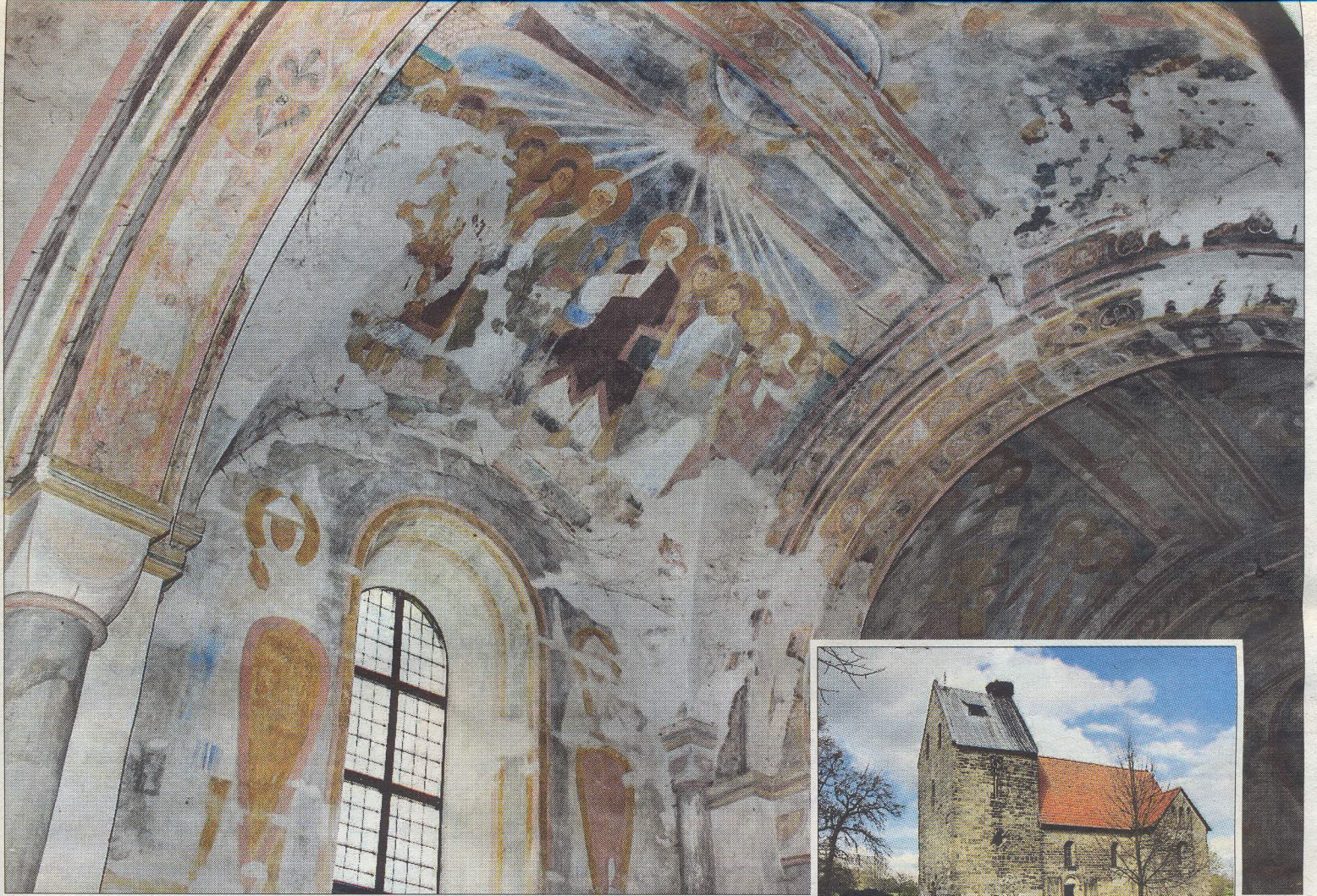
Die Fresken in der Sigwardskirche in Idensen sollen zunächst einmal gereinigt werden. Sokoll (2)